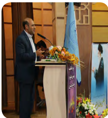
«دبیر کمیسیون مبارزه با قاچاق کالا و ارز کردستان»

در آیین اختتامیه ی دومین جشنواره ی استانی «پیوه» که در سنندج برگزار شد، حسین فیروزی معاون استاندار کردستان از برگزاری سومین جشنواره منطقه ای فرهنگی هنری «پیوه» مهرماه امسال در استان کردستان خبر داد. حسین فیروزی ضمن بیان اینکه «پیوه» کلمه ای کردی است و به معنی اندازه گیری، مقیاس و معیار می باشد، گفت: در دروس آموزشی پایه ابتدایی معیار اندازه گیری گنجانده شده و دانش آموزان از همان ابتدا معیار اندازه گیری مشخص، مقدار و اندازه هر چیزی را تبیین می کنند و یاد می گیرند. معاون هماهنگی امور اقتصادی و توسعه منابع استانداری کردستان افزود: با رعایت کردن استاندارد و ارائه کالا و یا خدمات مطلوب به مردم تا حد زیادی از مصارف غیرضروری و هدر روی منابع در کشور جلوگیری خواهد شد. استاندارد، کیفیت و ارزش یک محصول یا یک کالا و خدماتی که تولید می شوند را ارتقاء می دهد و امیدواریم برگزاری این گونه جشنواره ها و پیام و اهداف آن در بین تمام جامعه عمومیت و اشاعه پیدا کند. وی گفت: سومین جشنواره ی منطقه ای فرهنگی هنری «پیوه» مهرماه امسال در استان کردستان برگزار می شود.